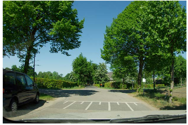
Bij de kruising met de Anneville-laan RECHTDOOR!!!