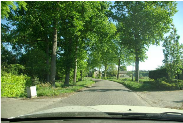
LET OP!! Gevaarlijke Bocht, Matig Uwsnelheid!!