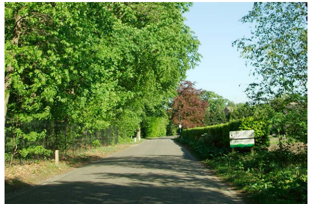
900 meter na het kruispunt komt U bij de oprijlaan van Anneville