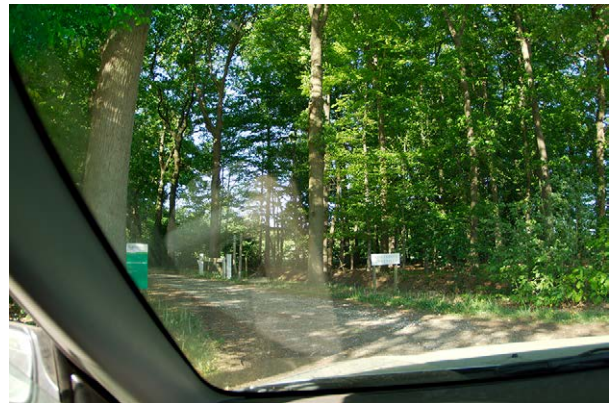
... hier in rijden...