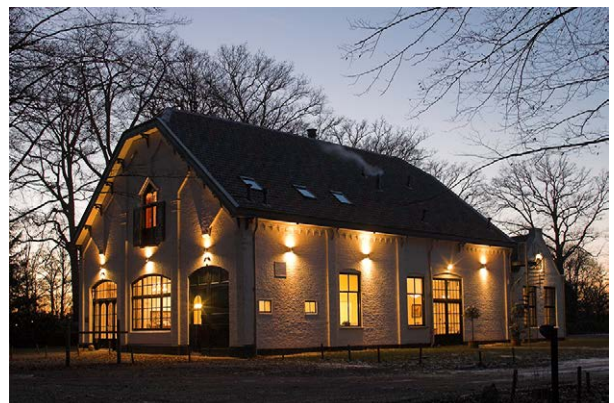
... naar Het Koetshuis!